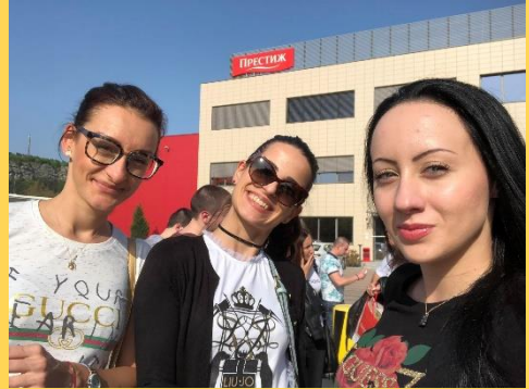
Снимка на Пътувация Семинар

СТУДЕНТИТЕ ОСТАВАТ ОЧАРОВАНИ ОТ ВЪЗМОЖНОСТИТЕ, КОИТО ФИРМАТА ПРЕДЛАГА ЗА ПЛАТЕН СТАЖ, КАКТО И ФАКТЪТ, ЧЕ НАЙ-ДОБРИТЕ СРЕД СТАЖУВАЩИТЕ ПОЛУЧАВАТ ПРЕДЛОЖЕНИЕ ЗА ПОСТОЯННА РАБОТА. ДРУЖЕСТВОТО Е ИНИЦИАТОР НА ПРОГРАМАТА „АКАДЕМИЯ – БЪДЕЩЕТО Е ДНЕС“, КОЯТО СЕ КАСАЕ ДО ДЕЦАТА НА СЛУЖИТЕЛИТЕ НА ВЪЗРАСТ МЕЖДУ 14 И 19 ГОДИНИ, КОИТО СЛЕДВА ДА РАЗВИЯТ И УСЪВЪРШЕНСТВАТ ЗНАНИЯТА СИ В СФЕРАТА НА КОМУНИКАЦИОННИТЕ И ПРЕЗЕНТАЦИОННИТЕ УМЕНИЯ. ДНИТЕ ЗА БЕЗОПАСНОСТ, В КОИТО ПРЕДСТАВИТЕЛИ НА АВТОРИТЕТНИТЕ ПРОФЕСИИ КАТО ПОЖАРНИКАР ИЛИ ПОЛИЦАЙ ИЗНАСЯТ ЛЕКЦИИ НА ДЕЦАТА СА МЕРОПРИЯТИЯ, НЕИЗМЕННА ЧАСТ ОТ СОЦИАЛНО НАСОЧЕНАТА ИНИЦИАТИВА НА КОМПАНИЯТА КЪМ НЕЙНИТЕ СЛУЖИТЕЛИ.